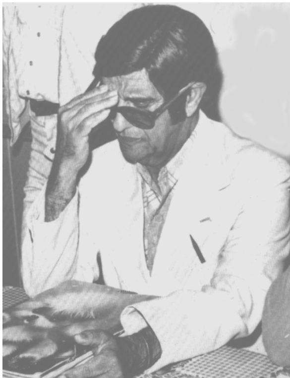
1975. Chico Xavier en el Grupo Espírita de la Oración, en Uberaba.