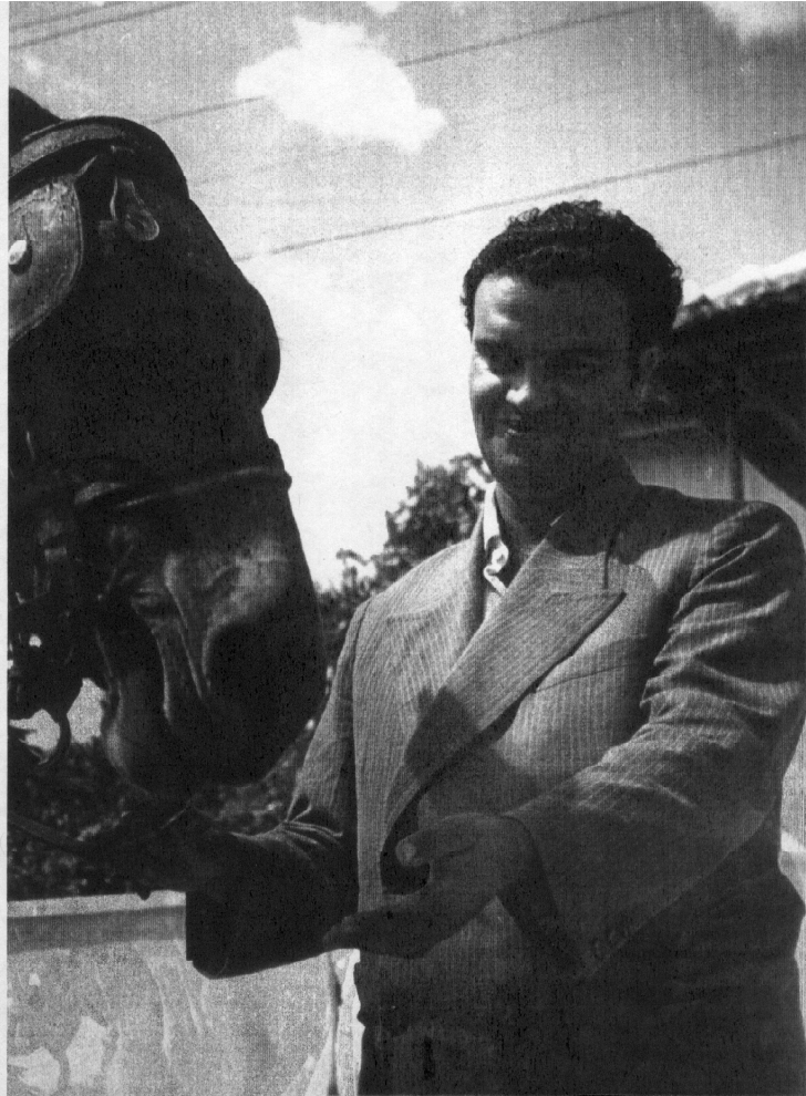
Chico Xavier en su juventud